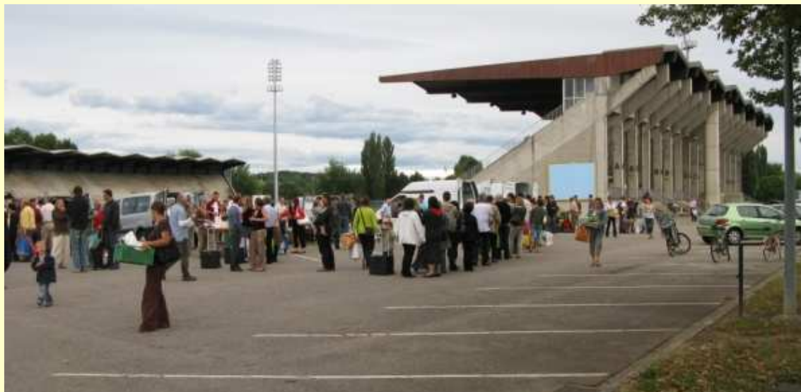
DM na futbalovom štadióne v meste Mulhouse