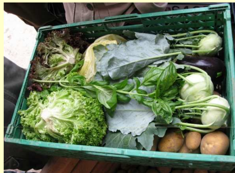
Zeleninový spotrebiteľský košík

• spotrebiteľia si vyberajú si veľkosť košíkov (malý, stredný, veľký). Nie je však možné, aby si každý spotrebiteľ objednával rôzne množstvo produktov.