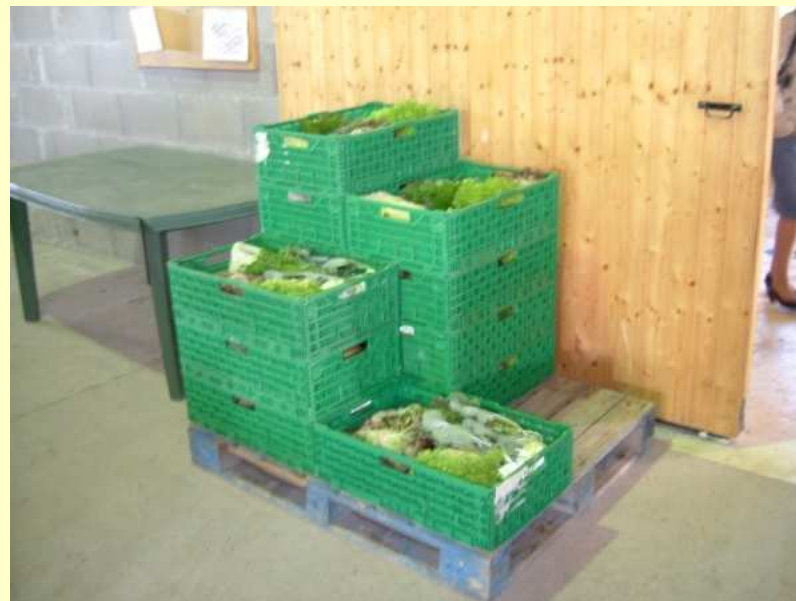
Zeleninové košíky pripravené pre spotrebiteľov