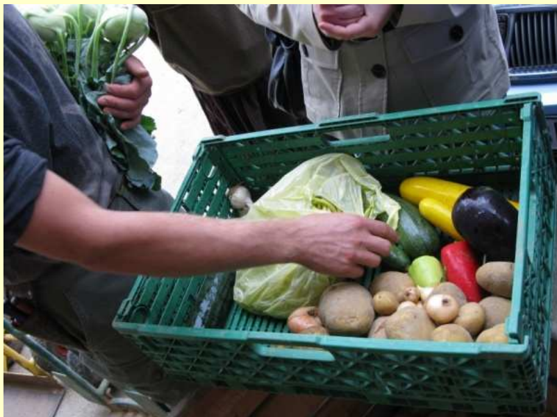
Tvorba zeleninového košíka