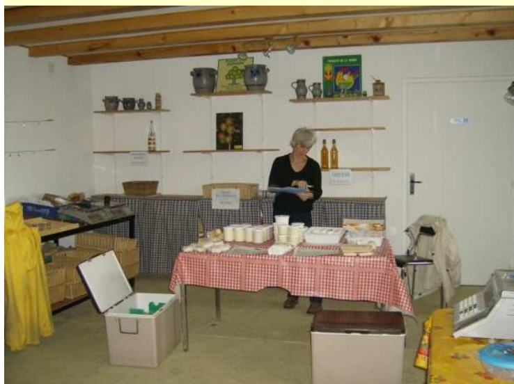
Stánok so syrmi – DM v dedine Muespach